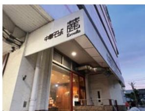
⑨ 中華そば 麓 (fumoto)