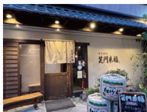
⑥ 炭火焼肉 笑門来福