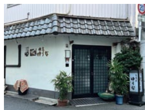
⑧ 割烹 ゆうな