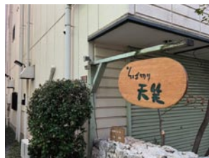
③ そば切り 天笑