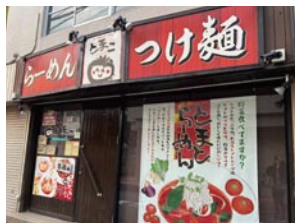
④ 真っ赤ならーめん とまこ 枚方市役所前店