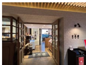
⑦ 京鼎樓 枚方T-SITE店